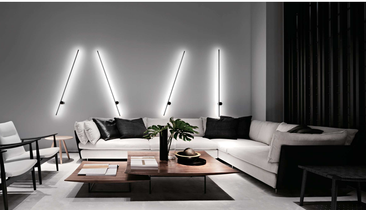
Salone del Mobile 2016

Ritzwell の「 LIGHT FIELD modular sofa 」が世界でもっとも権威のあるデザイン賞の一つである iF デザインアワードを受賞しました。今回受賞いたしました「 LIGHT FIELD modular sofa」はインテリア分野での受賞となります。ドイツのハノーファーを本拠地とする iF インターナショナル・フォーラム・デザイン は、ドイツで最も長い歴史を持つ独立したデザイン団体で、毎年優れたデザインを選出し「 iF DESIGN AWARD 」を授与しています。59 の国 / 地域から集まった 5,500 件を上回る応募デザインは、58 名のデザイン専門家が厳正な審査を行い、弊社の「 LIGHT FIELD modular sofa 」は「 自然素材独特の風合いを生かし、厚革のシャープなフォルムに漂う浮遊感が生み出す優美なデザイン」が高く評価され、今回の受賞となりました。