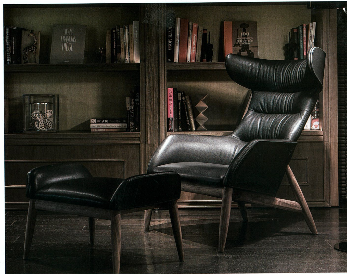
BEATRIX HIGH-BACK EASY CHAIR, OTTOMAN

東京 107-0062 東京都港区南青山2-13-7 マトリス3F tel.03-5772-3460 fax.03-5772-3461 大阪 542-0081 大阪市中央区南船場4-7-6 心斎橋中央ビルB1F tel.06-4963-8777 fax.06-4963-8778 福岡 812-0888 福岡市博多区板付5-2-9 tel.092-584-2240 fax.092-584-2241 Milano Ritzwell Italia S.r.l. Milano, Italia