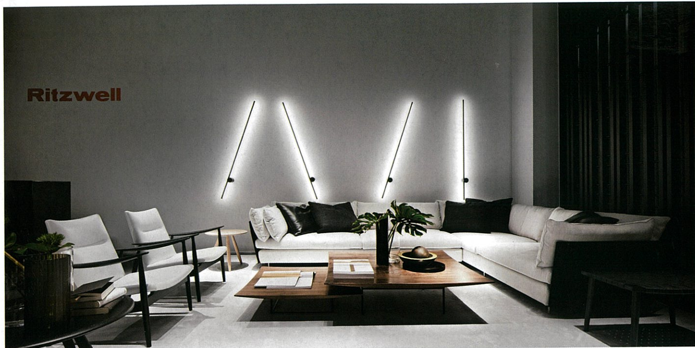
LIGHT FIELD: 両肘ソファ3人掛(LL) ¥955,000~ / 右肘ソファ3人掛(LL) ¥825,000~ SALONE DEL MOBILE MILANO 2016